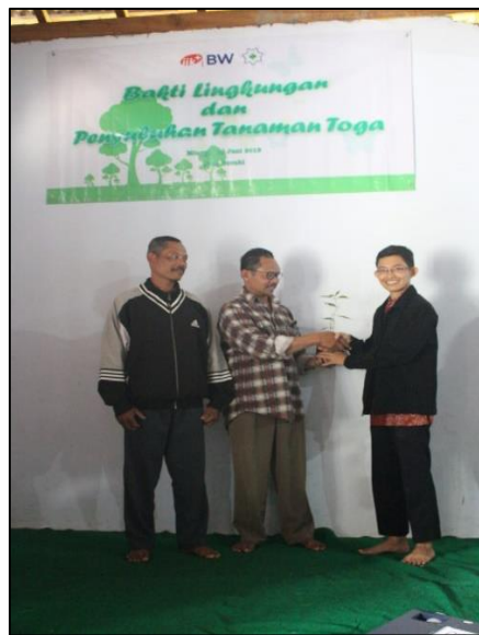
Gambar 3. Pemberian contoh TOGA

Menurut Abbas A. dan Pebrianty (2017) bahwa upaya peningkatan pengetahuan melalui edukasi merupakan hal yang sangat penting. Hal ini karena pengetahuan merupakan domain yang penting dalam membentuk tindakan seseorang. Tindakan yang didasarkan oleh pengetahuan akan lebih lama melekat dibandingkan dengan perilaku yang tidak didasari dengan pengetahuan. Teori SOR menyatakan bahwa respon merupakan reaksi dari individu ketika menerima stimulus dari suatu proses. Stimulus diperoleh dari apa yang panca indera tangkap dalam kegiatan edukasi baik berupa penyampaian materi secara langsung (ceramah) maupun melalui leaflet yang dibagikan kepada masyarakat.