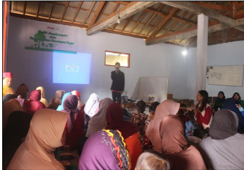
Gambar 1. Kekikutsertaan masyarakat dalam kegiatan penyuluhan

Kegiatan pengabdian kepada masyarakat telah terlaksana dengan lancar atas dukungan pemerintah setempat dan partisipasi aktif masyarakat Desa Besuki Kecamatan Mojo Kabupaten Kediri. Hal ini sejalan dengan pernyataan Nur dan Rahma (2020) bahwa masyarakat mengharapkan agar kegiatan seperti ini selalu diadakan disana, sebab hal tersebut sangatlah bermanfaat bagi masyarakat.