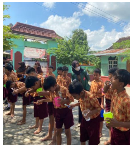
Gambar 1. Kegiatan edukasi perilaku hidup bersih sehat dan pertolongan pertama pada luka