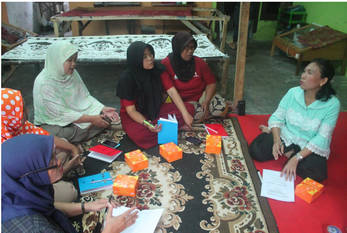
Gambar 3. Ibu-ibu di Desa Pematang Johar sedang mendapat pelatihan membuat laporan keuangan sederhana untuk usaha kecil