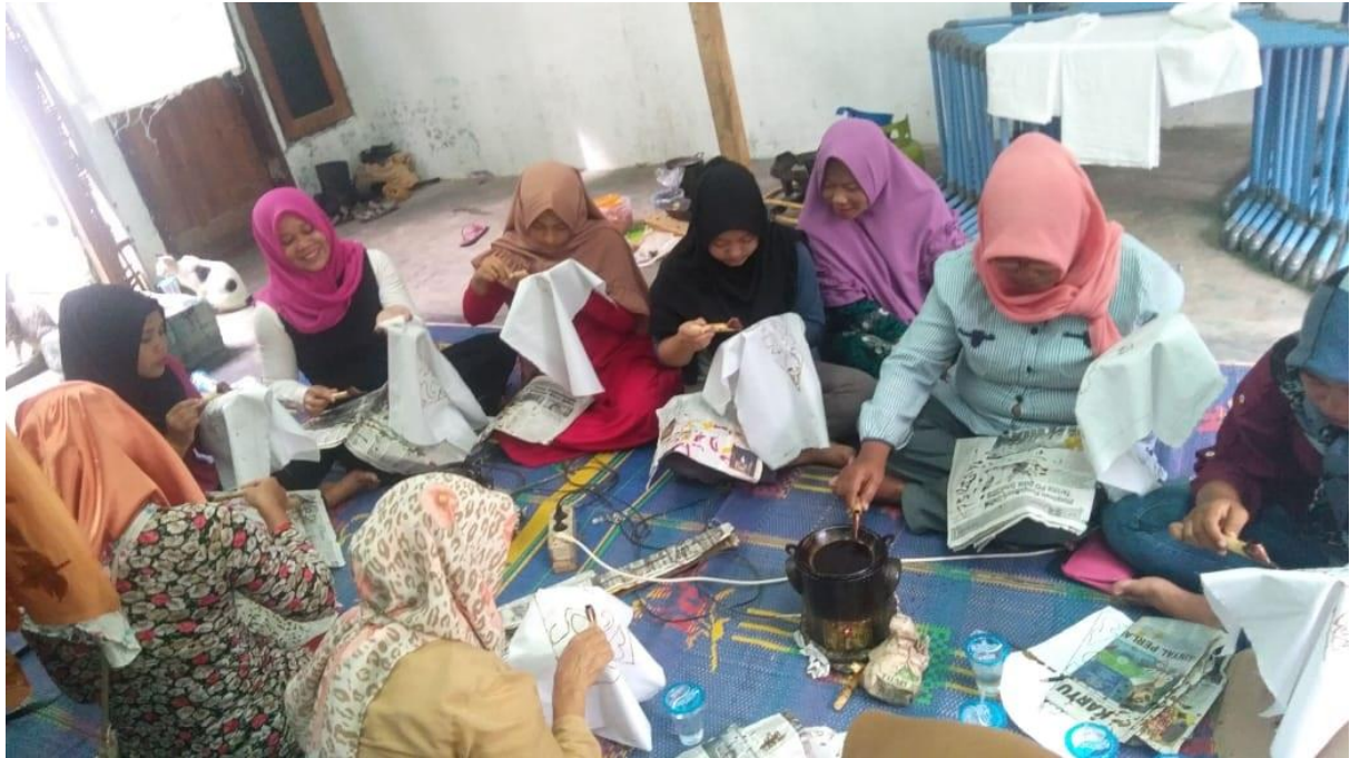
Gambar 4. Ibu-ibu di Desa Pematang Johar sedang mendapatkan pelatihan membatik

Berikut adalah diagram alir prosedur kerja untuk mendukung realisasi metode yang diterapkan pada kegiatan PKM batik mangrove di Desa Pematang Johar, yaitu